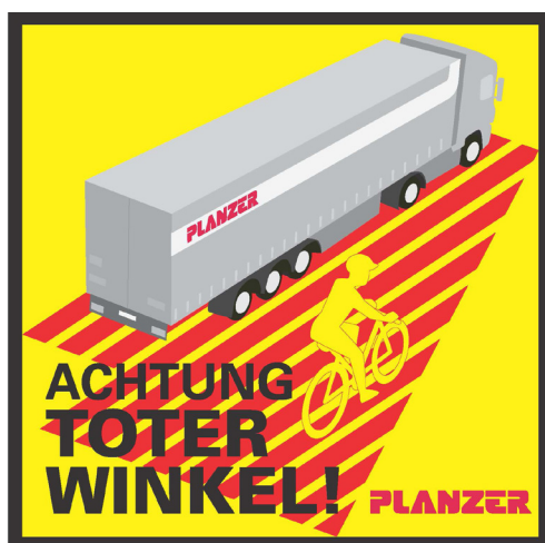
Der Sicherheitskleber in der Variante Planzer

Das Thema Verkehrssicherheit liegt Planzer als 100%-iges Familienunternehmen schon seit jeher besonders am Herzen. Bereits seit vielen Jahren schult Planzer deshalb, mit eigens dafür ausgebildeten Instruktoren, Primarschülerinnen und -schüler an verschiedenen Planzer-Standorten in der ganzen Schweiz im Umgang mit dem toten Winkel. Als zusätzliche präventive Massnahme rüstet die Planzer-Gruppe nun im April 2014 den Grossteil seiner Flotte, schweizweit insgesamt mehrere Hundert LKWs, mit einem auffälligen gelben Sicherheitshinweis aus.